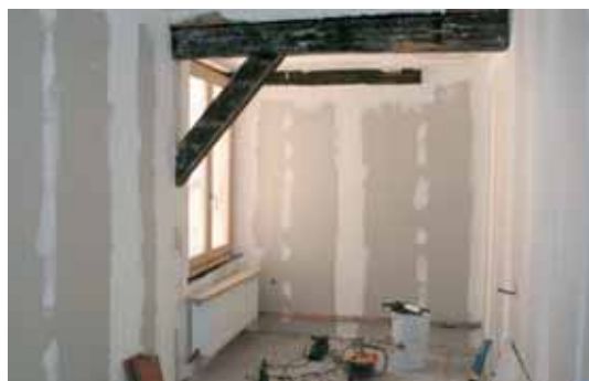
Mariage réussi entre le vieux et le neuf

C.E.R.V.E.A.U. • 89, avenue de Colmar • 67100 STRASBOURG • Tél. 03 88 44 09 08