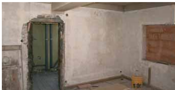
Une future chambre en chantier