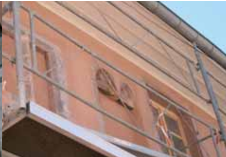
Le chantier, une occasion de redécouvrir des trésors cachés, avec ici la mise à jour d'encadrements datés du XIII e siècle, préservés sous le crépis, témoins des transformations successives de cette bâtisse construite sur le premier rempart de la ville.