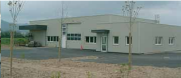
METALBOI 67 - ZI Nord Sud Todenco, Rue de Charleroi - 67600 SÉLESTAT