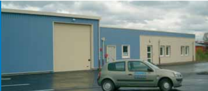
PROMES SARL - ZI du Sulzfeld, 5 rue des Moulins - 67730 CHÂTENOIS