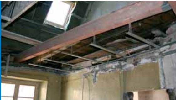
Exemple de modification de l'espace intérieur dans le respect des volumes existants