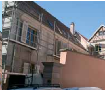
Vue générale des bâtiments rénovés, situés dans le centre historique de Sélestat.