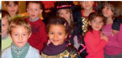
Centre de loisirs de Sélestat