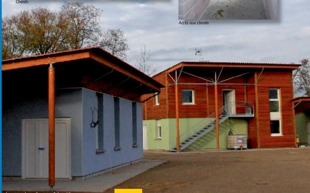
Logement du gardien, accueil du public