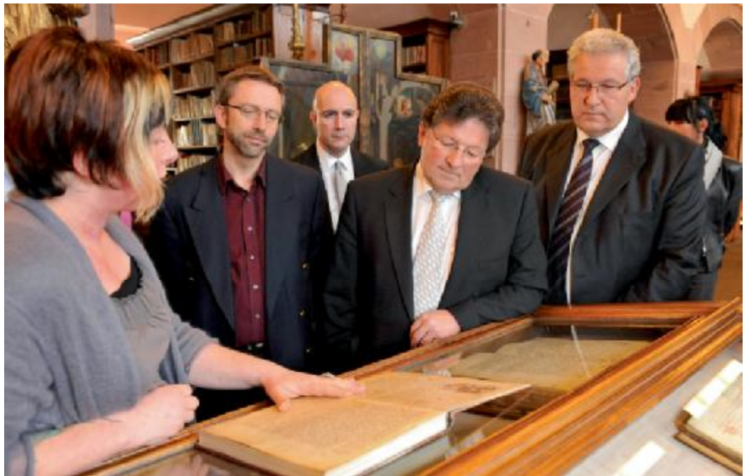
Visite de la Bibliothèque Humaniste

La réflexion et le travail sur l'amélioration de ces liens ont conduit le Département à proposer aux collectivités de signer un Contrat de Territoire en remplacement des chartes de développement.