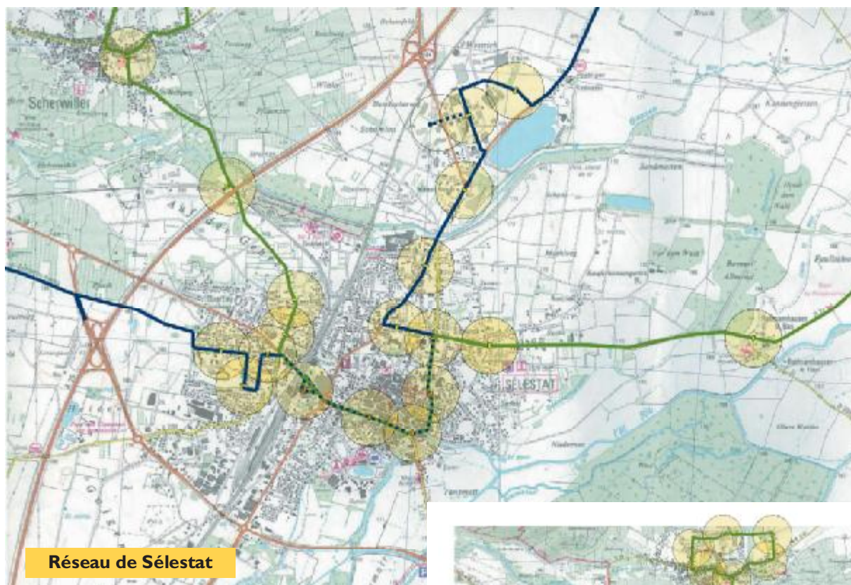
Réseau de Sélestat

Une seule réponse a été déposée, à savoir celle du sortant associé à l'entreprise Bus-Est (voir encadré). Plusieurs réunions de négociations ont eu lieu et ont permis d'affiner la réponse proposée. Le nouveau contrat avec le groupement Autocars Schmitt/Bus-Est aura une durée de 7 ans.