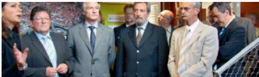
Visite guidée par l'architecte