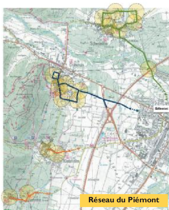
Réseau du Piémont

L'exploitant mettra en oeuvre des nouveaux bus de dernière