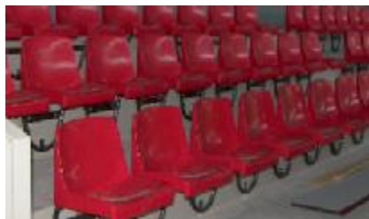
Sièges des tribunes