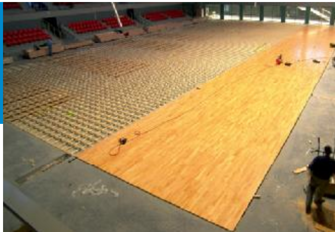
Salle du Centre Sportif Intercommunal