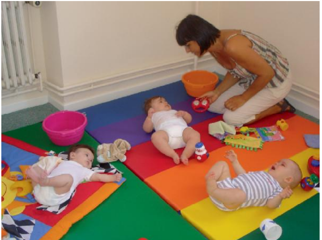
Micro crèche d'Ebersheim

Dans l'optique de répondre à vos besoins, la C.C.S.