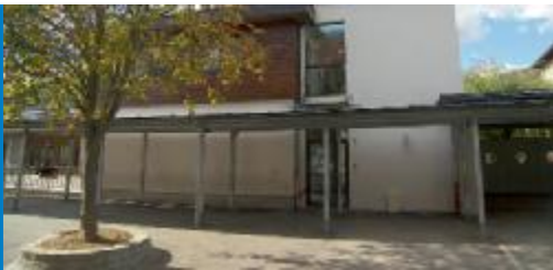
Péricolaire de Kintzheim Orschwiller