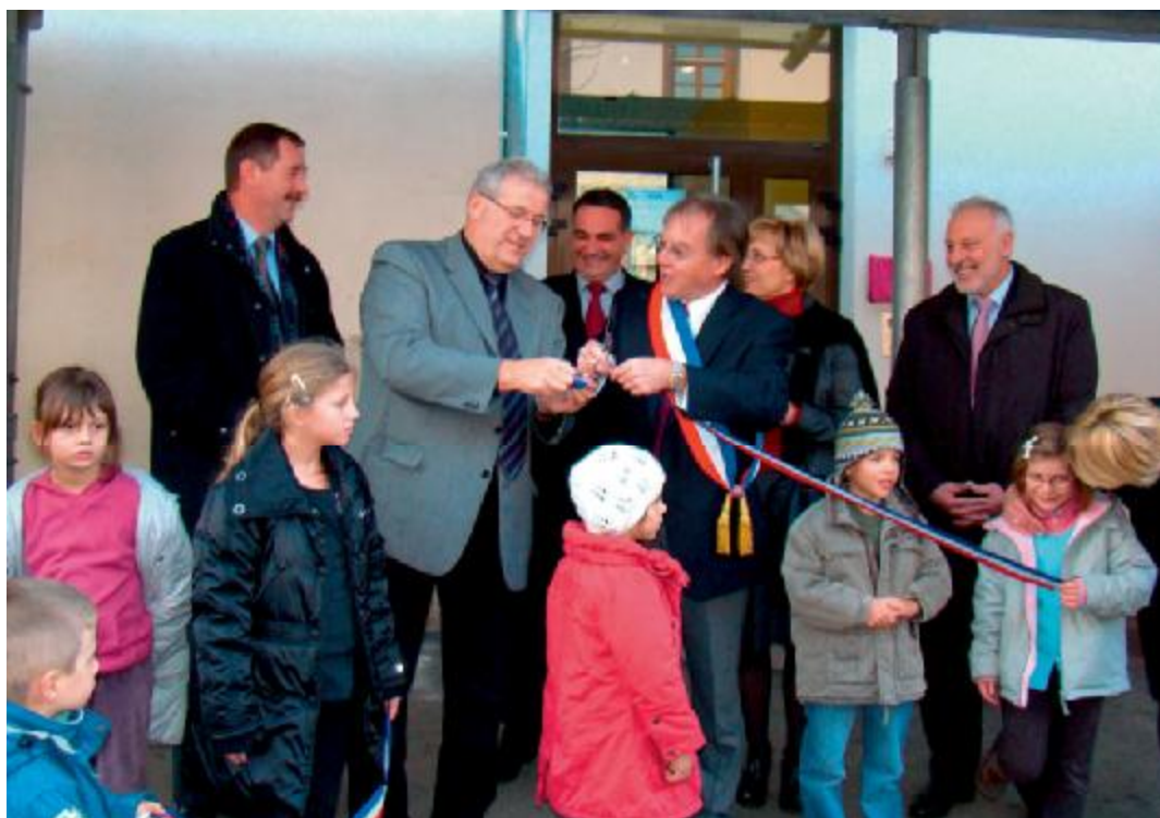
Inauguration du périscolaire à Kintzheim