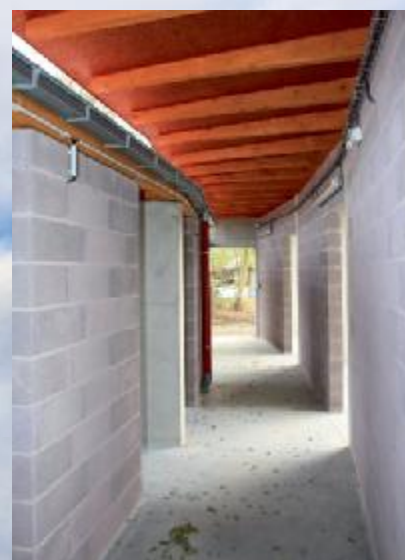
Accès aux chenils