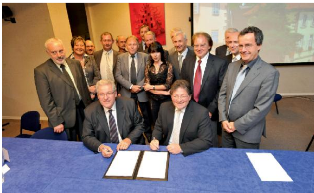
Les 12 maires de la C.C.S., le Président du Conseil Général et les autres officiels