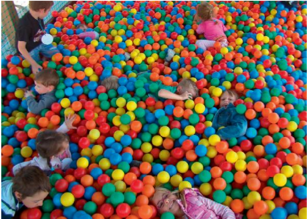
Centre de loisirs : sortie au Vaisseau

a décidé d'accepter la proposition de la Farandole de créer deux micro crèches à Châtenois et Ebersheim.