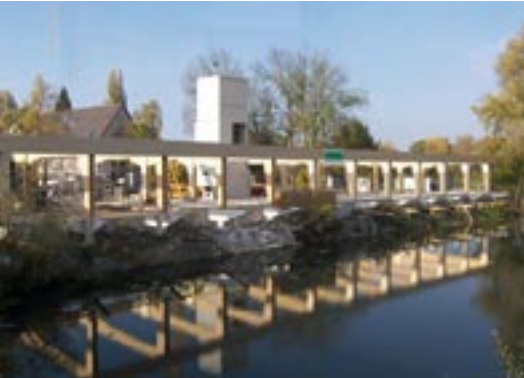
Charpente du bâtiment hébergement.