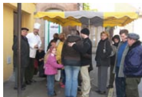
La file devant le laboratoire KAMM.