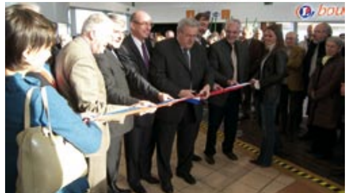
Inauguration de l'aire de services.