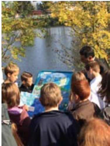
Inauguration du sentier de la goutte d'eau.

D'une longueur d'environ 900 m, elle est entièrement enrobée et ouverte également au trafic agricole.