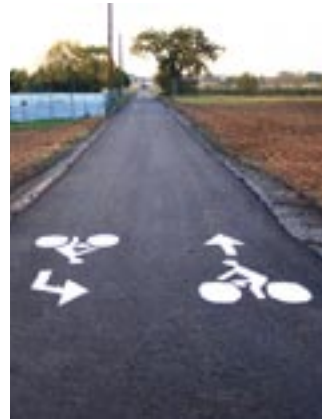
Piste cyclable Scherwiller / Kientzville.