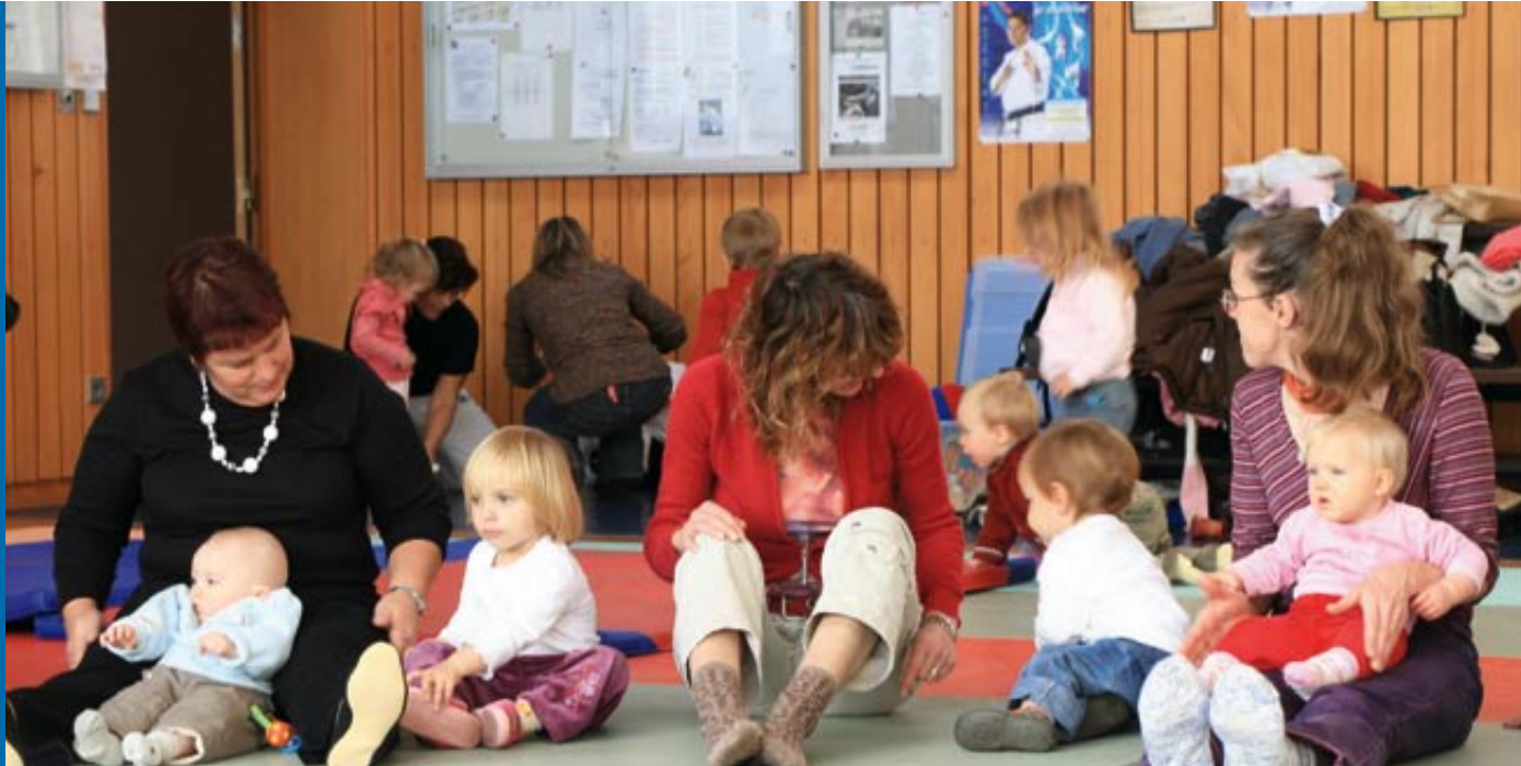
Animation du Ram.