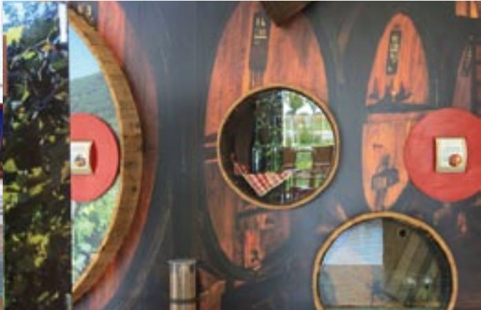
Module Piémont viticole.