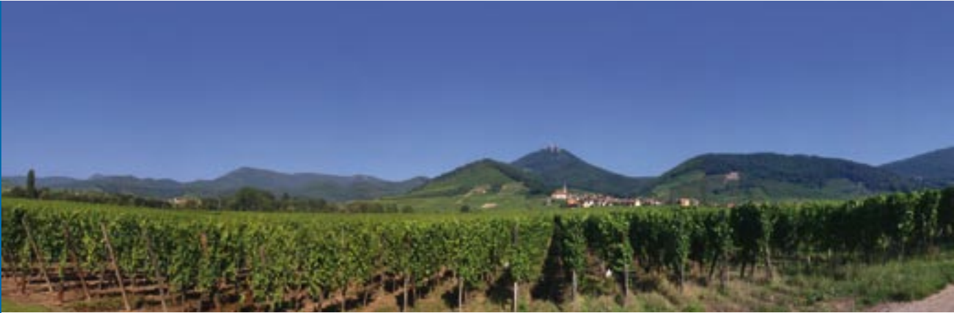
Paysage du Piémont.