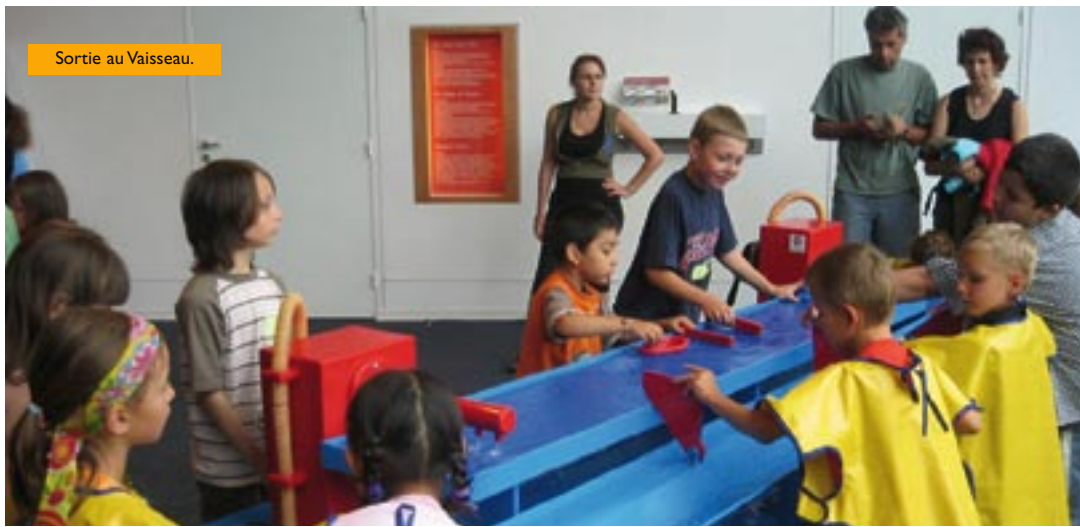
Sortie au Vaisseau.