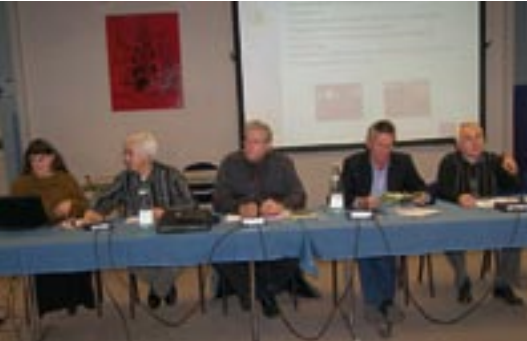
Intervention du SMICTOM.