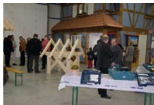
Explications sur les charpentes à Charpente BAYARD.