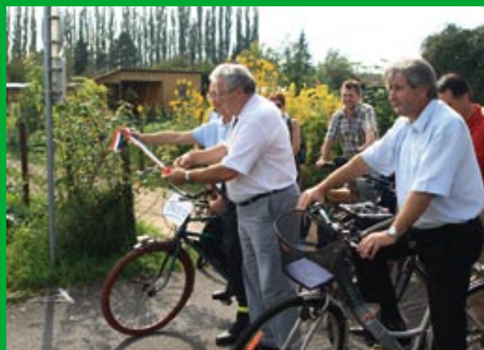
Inauguration de la piste.

Pose de la première pierre et inauguration de la piste cyclable Sélestat / Muttersholtz