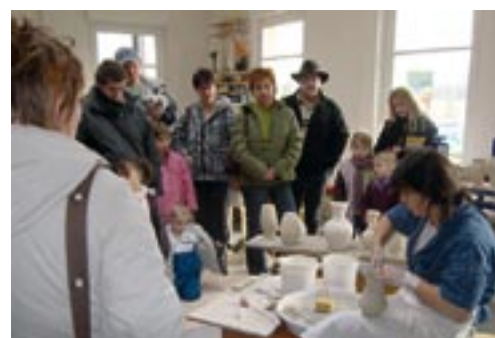
Démonstration au tour de potier à Textures.