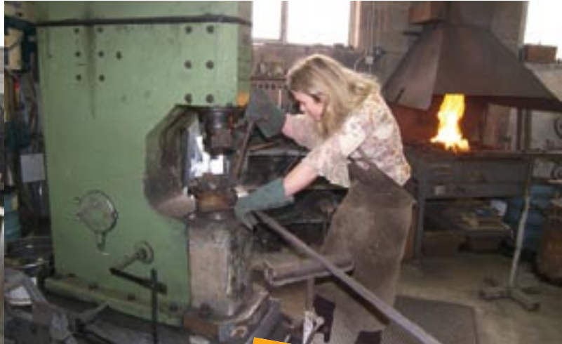
Démonstration de forge.