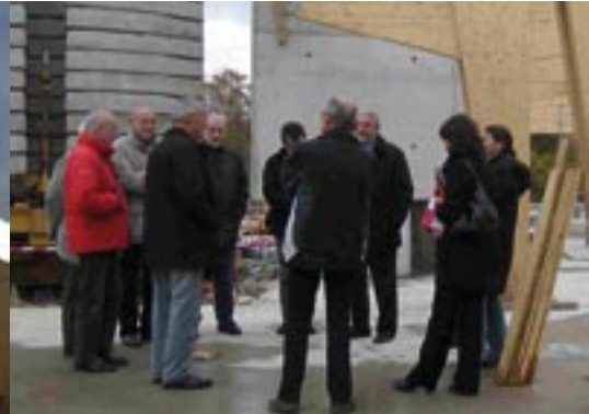
Visite de chantier le 07 novembre.