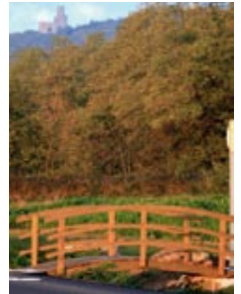
Piste cyclable Scherwiller / Kientzville.