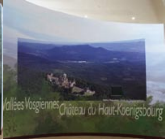
Module Vallées Vosgiennes et Haut-Koenigsbourg.