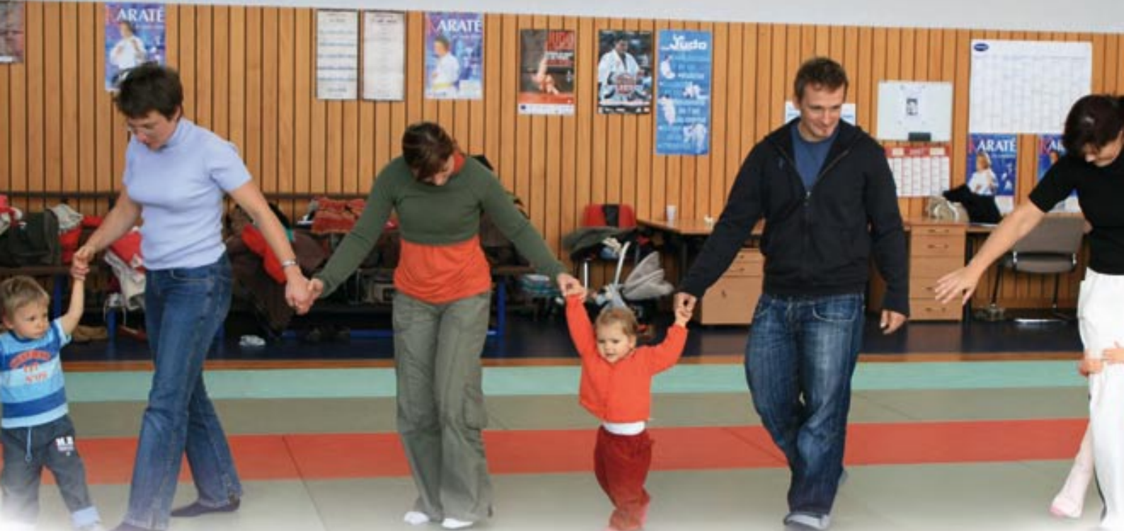
Animation du Ram.

un premier temps, les modes de gestions, habitudes de fonctionnement seront préservés. A terme, il conviendra d'uniformiser certains points : services proposés, tarifs... dans un souci d'équité sur le territoire.