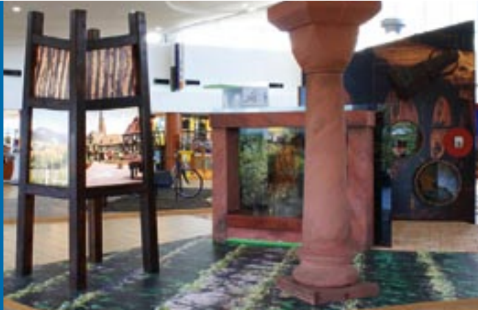
Module Piémont viticole.