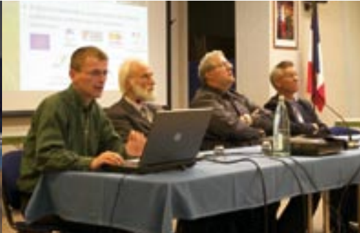
L'assemblée à l'écoute de la présentation du SCOT.