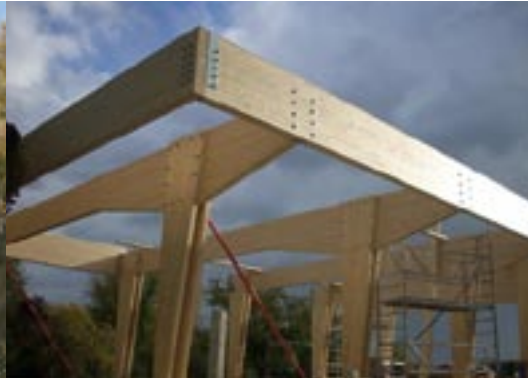
Détail de charpente.