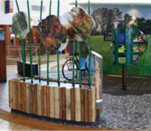
Module Grand Ried.