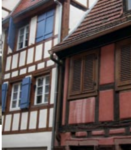
Réhabilitation, rue de la Cigogne, Sélestat.