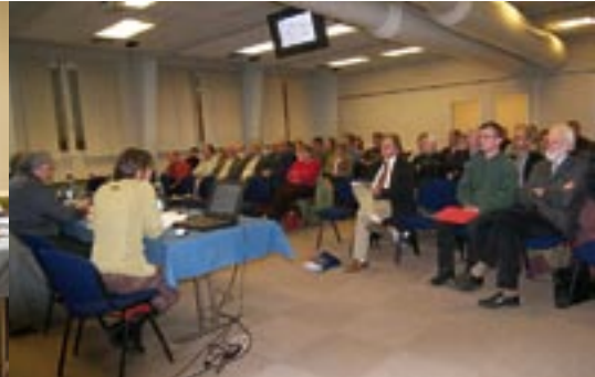
Présentation du Conservatoire des sites alsaciens.