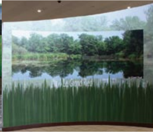
Module Grand Ried.